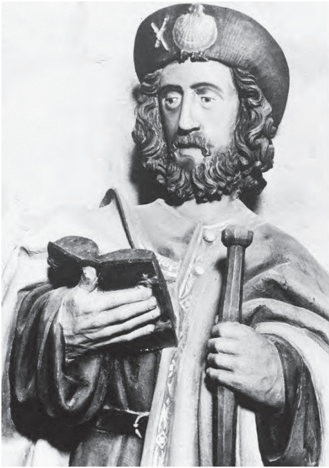
Detail der Apostelfigur Jakobus d. Ä.

Viele Kunstwerke fallen im Laufe der Zeit dem wechselnden Geschmack, den Gewalten der Natur oder dem profanen Diebstahl zum Opfer. Fehlende finanzielle Mittel können auch dazu beitragen, dass Kunstwerke nicht im optimalen Zustand bewahrt werden können.