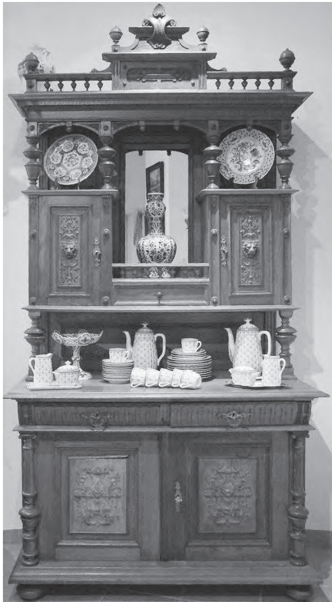
Ein neues Schmuckstück für den Pulverturm: Der neue Schrank ergänzt das Mobiliar des Heimatvereins.