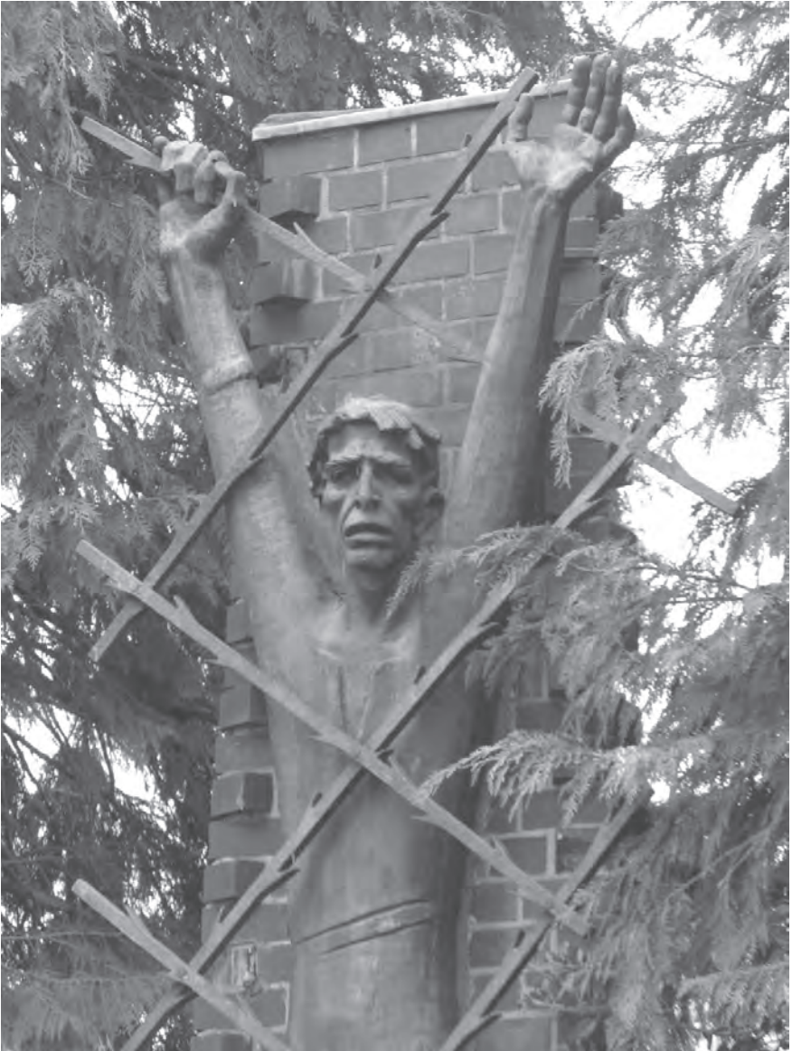
Das Mahnmal „Gegen Unfreiheit und Gewalt“ am Schützenwall (1961). Foto: Hendrik M. Lange, 2015.