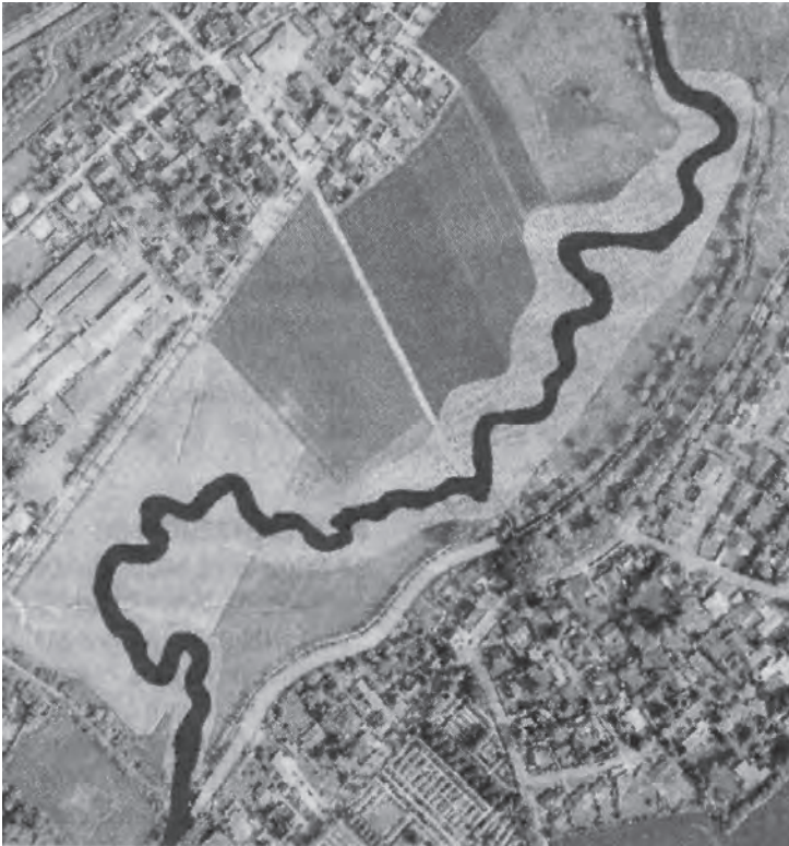
Der Flusslauf der Berkel soll 2017 in die Fürstenwiesen umgelegt werden. der Altarm ist im unteren Bildbereich zu erkennen. Karte: Abwasserwerk der Stadt Coesfeld.

Aber zurück zu den Fürstenwiesen! Hier plant die Stadt eine ökologische Verbesserung des Berkelverlaufs. Die Berkel soll „naturnah“ mitten durch die Fürstenwiesen geführt werden. Dabei soll das alte Bett der Berkel nordöstlich der Fürstenwiesen als „Altarm mit stehendem Gewässercharakter“ erhalten bleiben (vgl. Karte). Gleichzeitig ist vorgesehen, dass der gesamte Bereich der Fürstenwiesen künftig Naherholungscharakter erhalten soll. Das Gebiet würde dann erschlossen durch den bereits erwähnten, von der Osterwickerstraße abgehenden Fuß- und Radweg einerseits und die von der Billerbeckerstraße zur Osterwickerstraße führenden „Verbindungsachse Blumenesch“ andererseits; letztere soll ebenfalls als Fuß-/Radweg ausgestaltet werden und eine Reihe von „Beobachtungspunkten“ erhalten.