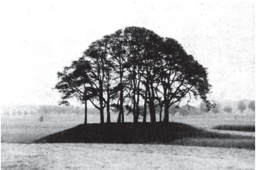
Der sogenannte Galgenhügel in Coesfeld, Aufnahme 1927. Im Hintergrund: Fürstenwiesen, rechts (die Allee): Billerbecker Straße, etwa auf der Höhe Deipe Stegge.

Möglicherweise wurde die Berkel bereits damals mitten durch den „Berkelsee“ geführt, wie es die jetzigen Planungen vorsehen. Den Verlauf der Wasserpalisaden markiert etwa der hintere Teil des hier in südöstlicher Richtung verlaufenden Weges, der von der Osterwickerstraße rechts (gegenüber dem Theaterparkplatz) die Fürstenwiesen entlang führt. Parallel zum vorderen Teil des Weges verläuft rechter Hand der Brinker Bach, der später am Walkenbrückentor in die Umflut I mündet. Etwa nach ca. 80 m erhebt sich rechts jenseits des Baches der sog. Galgenhügel, der früher ein charakteristisches Aussehen hatte (siehe Foto von 1927), weswegen man in Coesfeld zuweilen noch heute hört, dass dort eine Richtstätte gewesen sei; dies war jedoch nie der Fall. Inzwischen hat der Hügel längst sein früheres Aussehen verloren und führt, verborgen hinter hochwachsendem Strauchwerk, nur noch ein kümmerliches Dasein, und das, obwohl er als „Naturdenkmal“ noch heute auf Karten und Plänen erscheint!