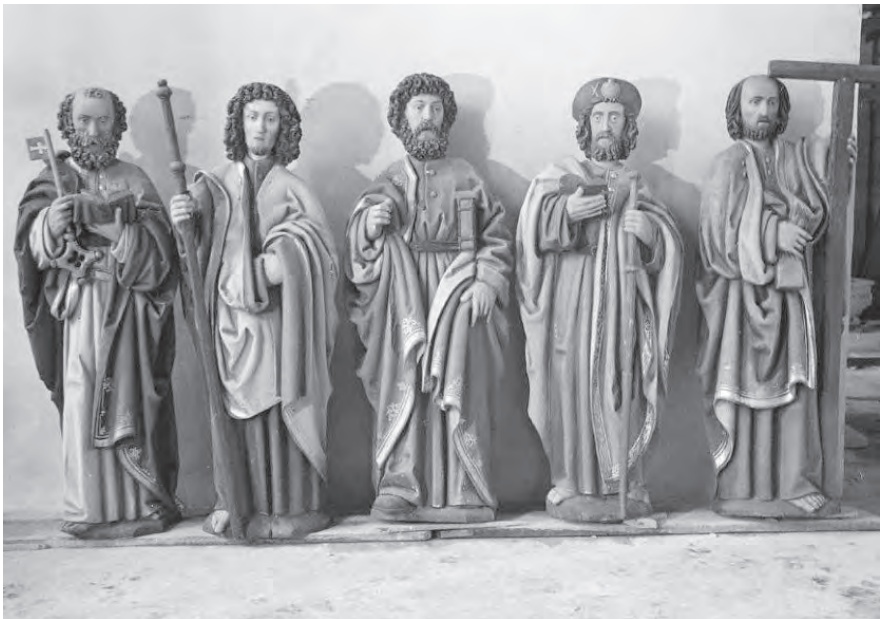
Die elf Apostel in St. Lamberti.