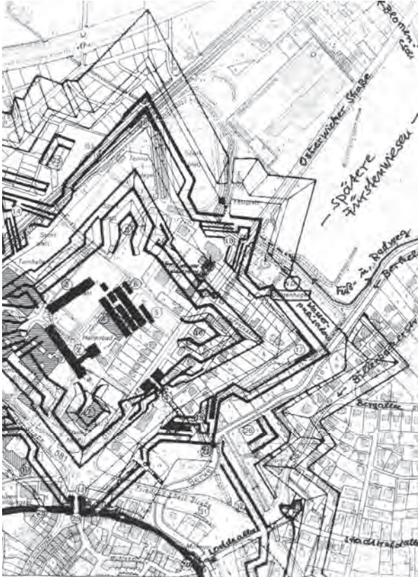
Die Lage der Fürstendiesen zur ehemaligen Zitadelle (1655–1988).

Berkel, die sich von dort Richtung Innenstadt bewegt. Die Wiesen wurden häufig als Heuwiesen genutzt. Sie liegen tiefer als die beiden vorgenannten Straßen und eignen sich daher gut als Hochwasser-Rückhaltebecken, wenn die Berkel über ihre Ufer tritt. In dieser Funktion sollen sie nach den Planungen auch künftig genutzt werden.