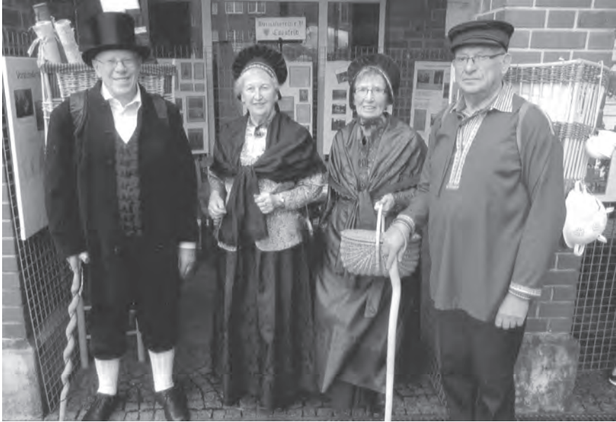
Vertreter des Heimatvereins auf dem Ursulamarkt in Coesfeld.