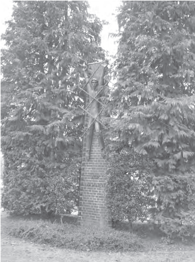
Das Mahnmal (2015), Foto: Hendrik M. Lange.