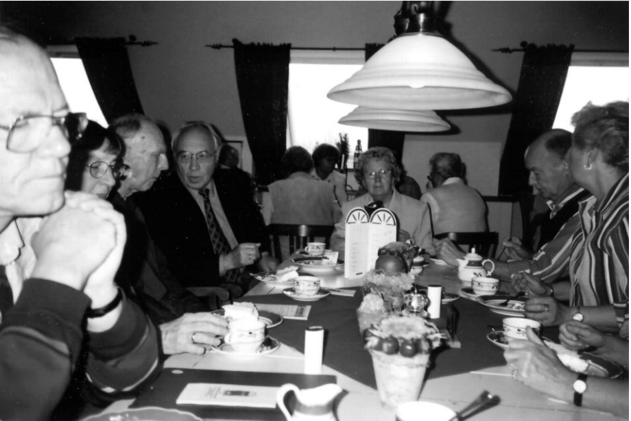
Besuch in Senden