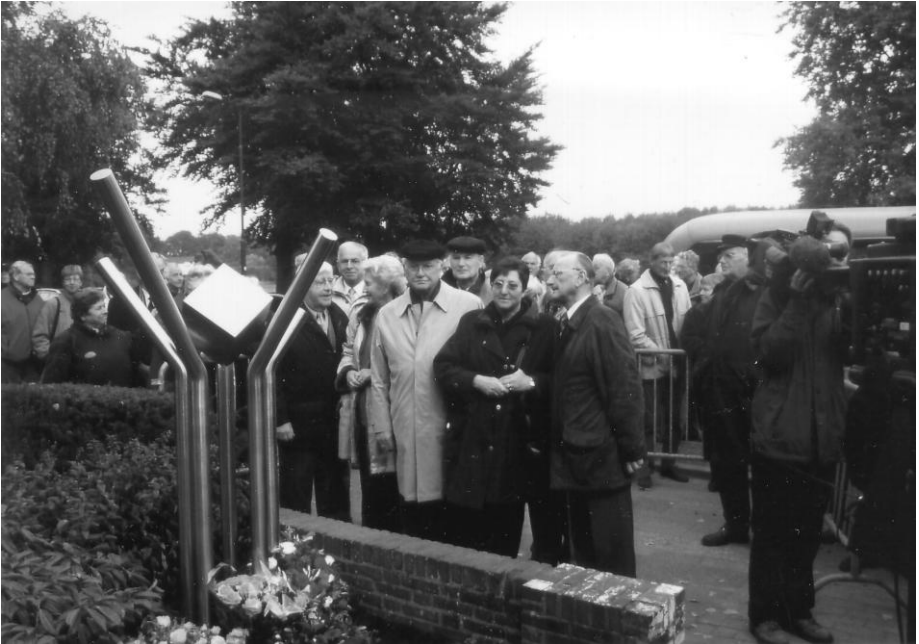
Enthüllung des Denkmahls in De Bilt.

Immer wieder wird der Heimatverein um Hilfe bei Stad.tführungen gebeten. Um auch in Zukunft über Stadtführer zu verfügen, die gut informiert ihre Stadt vorstellen, ist es an der Zeit, sich um Nachwuchs zu kümmern. Vor Jahren habe ich in einem „Stadtführer“ die wesentlichen Informationen zusammengestellt und exemplarisch eine Exkursion in Coesfeld durchgeführt. Es wäre schön, wenn sich im Heimatverein Interessenten finden würden, die gerne in unsere Fußstapfen treten und so eine ganz wichtige Aufgabe in Coesfeld übernehmen. Unserer Starthilfe können sie gewiß sein.