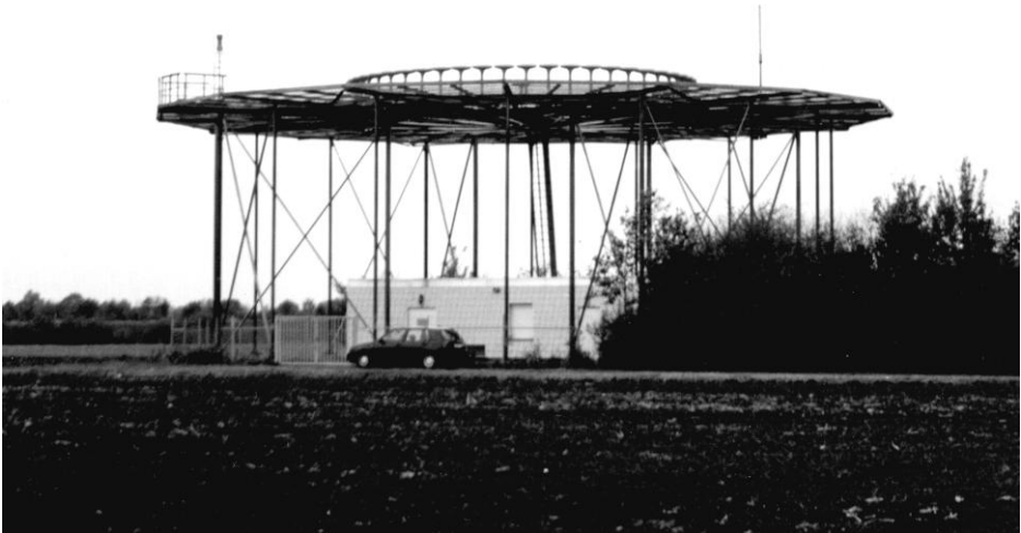
Funkfeuer DORTMUND in der Osterbauerschaft Südkirchen