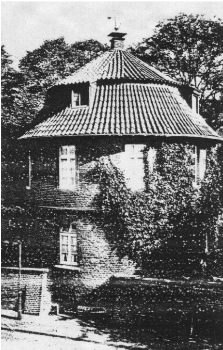
Der Pulverturm um 1930

Am 21. März 1945, kurz vor Ende des 2. Weltkrieges, brannte dieses historische Schmuckstück am Schützenring bei der Bombardierung Coesfelds völlig aus. Nur das Kellergewölbe und das Erdgeschoß mit mehr als ein Meter dicken Mauern widerstanden dem schweren Bombenhagel. Erst einige Jahre nach dem Krieg erfolgte der Wiederaufbau mit einfachem Kegeldach. Fünfzig Jahre, bis 1997, diente der Turm dann einer Coesfelder Familie als lieb gewonnene Wohnung. Wegen der hohen Restaurierungskosten und der großen Finanzschwäche der Gemeinden dauerte es geraume Zeit, bis man sich im Rathaus schlüssig wurde ob der weiteren Verwendung. Der Stadtrat schloß den Verkauf dieses historischen und denkmalgeschützten Gebäudes aus. Im Sommer 2002 kam es zu einer Vereinbarung zwischen der Stadt und dem Heimatverein Coesfeld. Dieser erhielt den Pulverturm als sein neues Domizil, verpflichtete sich aber gleichzeitig, das Innere des Gebäudes grundlegend zu restaurieren. Die Restaurierungsarbeiten waren nur mit großzügiger