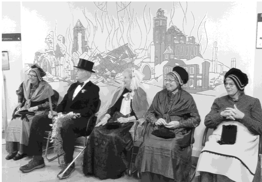
30 Jahre Städtepartnerschaft de Bilt – Coesfeld, Foto im Rathaus Coesfeld