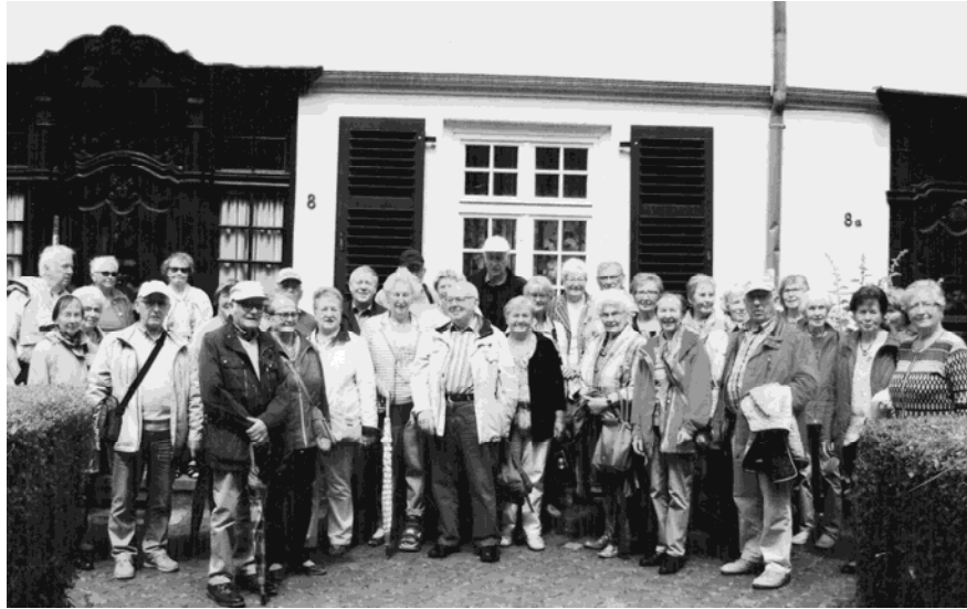
der Ruhr ging es durch das Ruhrtal bei schönsten Reisewetter. Die Ruhrbrücke eine beachtliche Leistung für unsere moderne Welt, wurde ein tolles Fotomotiv.